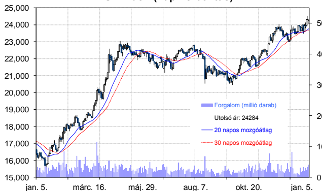
BUX Index (napi felbontás)