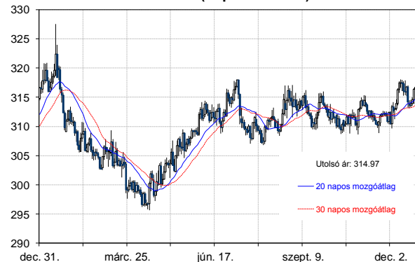
EUR/HUF (napi felbontás)