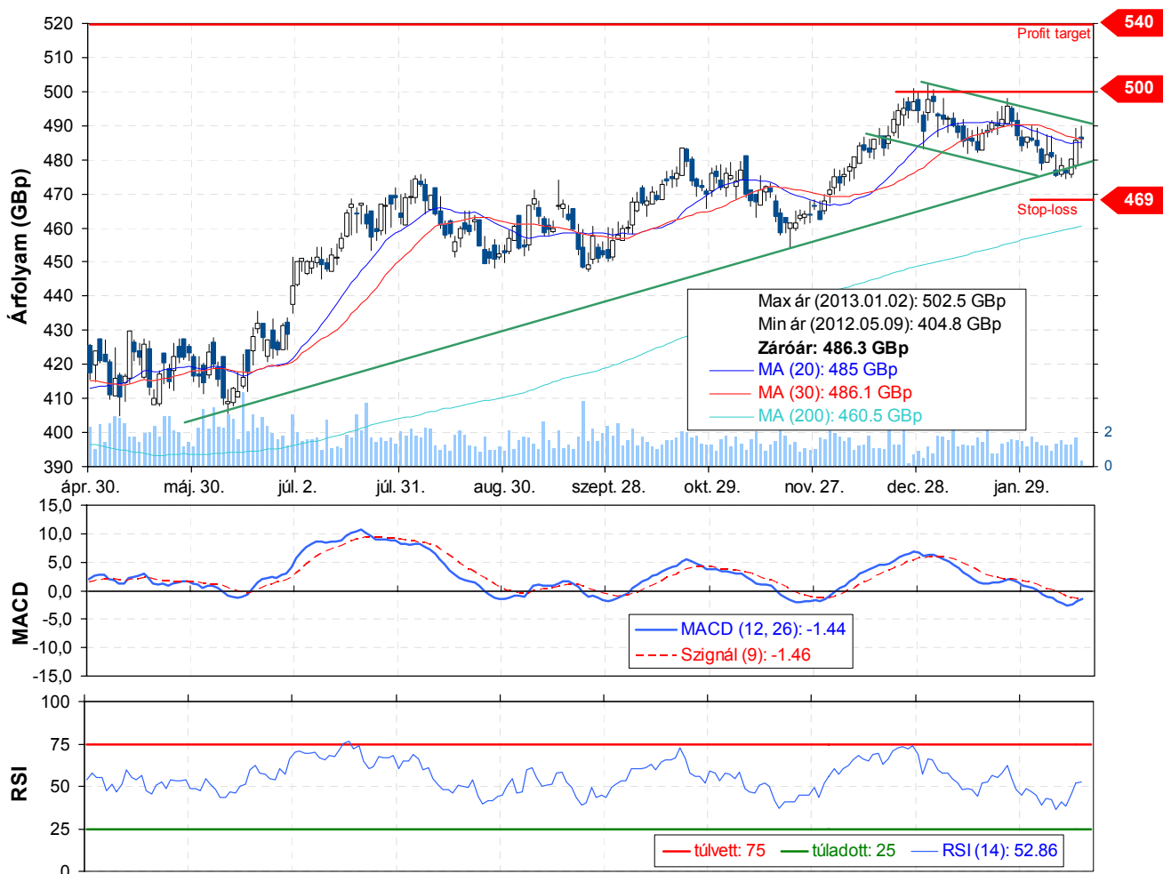
Hammerson Plc (napi bontás)

Az ingatlankezelő társaság grafikonjára pillantva rögtön kirajzolódik a stabil emelkedő trend, ami jó ideje meghatározza a papír mozgását. Ha az 500-as lokális csúcsot sikerrel küzdi le az árfolyam, akkor megerősítést nyer az emelkedő trend, és nagy tér nyílik felfelé.